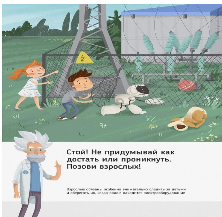
Рис. 5 Стой! Не придумывай как достать или проникнуть. Позови взрослых!