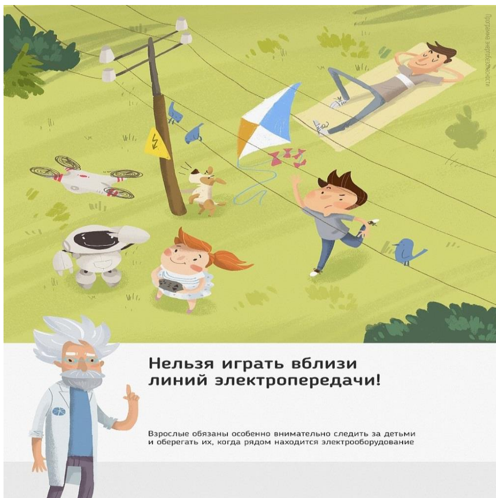
Рис.3 Нельзя играть вблизи линий электропередачи