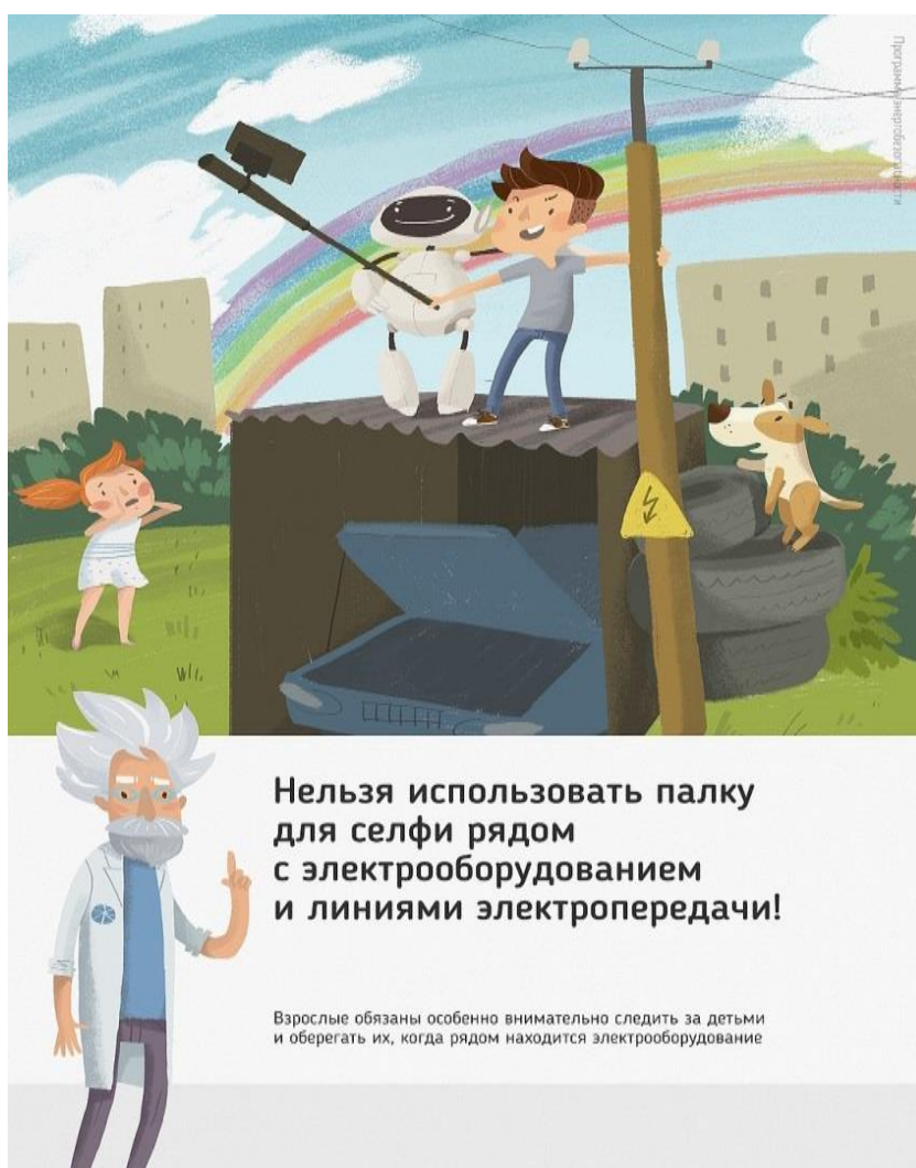
Рис 2. Нельзя использовать палку для селфи рядом с электрооборудованием и линиями

Ну и, наконец, нужно повторить с ребенком алгоритм действий в экстремальной ситуации. Проверьте, умеет ли он набирать на сотовом телефоне телефон экстренных служб. Изучите с ним вещества и предметы, которые хорошо проводят электрический ток и потому особенно опасны, и, наоборот, вещества и предметы, плохо проводящие электрический ток и полезные в экстремальной ситуации.